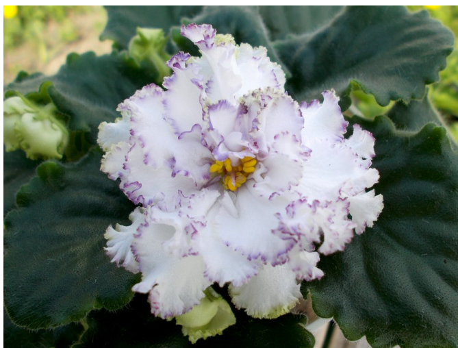
Ruský kultivar z produkce Fialkovodu AV-762-11.

Jiná situace ovšem nastává v případě, že již máme kultivar ověřený. Tehdy můžeme zbylé sazenice prodávat, aniž bychom vyčkávali na jejich první kvetení. Opět uvedu příklad: koupím si listový řízek AV-Skazka a získám z něj pět sazeniček. První sazenice vykvete podle popisu šlechtitele a já tedy vím, že k záměně ze strany prodejce nedošlo. Tuto správně kvetoucí sazenici si nechám pro sebe a zbylé čtyři pak mohu nabídnout dalším pěstitelům. Může se sice stát, že některá bude sportovat , ale to již neovlivním. V tomto případě je důležité, že nedojde k celkové záměně kultivaru.